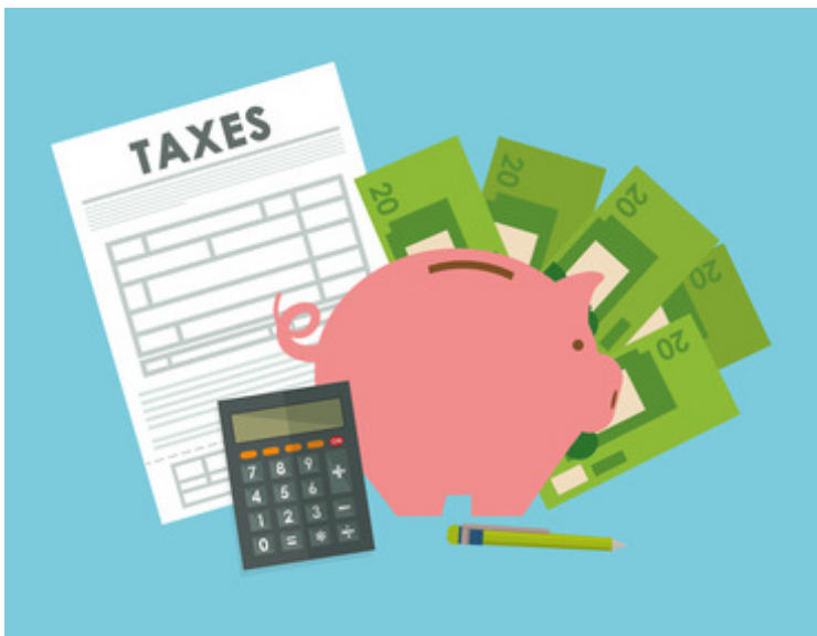
‘공유 경제’ 소득자를 위한 세금 기본

독립 계약자들은 소득세 이외에 사회 보장 및 메디케어 세금 전액으로 구성된 (고용주 지원 없음) 자영업 세금을 납부해야 한다는 것을 알고 계십시오. IRS의 자영업자 세금 센터 ( https://www.irs.gov/individuals/self-employed ) 에서 상세한 정보를 얻을 수 있습니다.